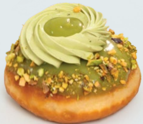
BERLINAS QUE ENAMORAN