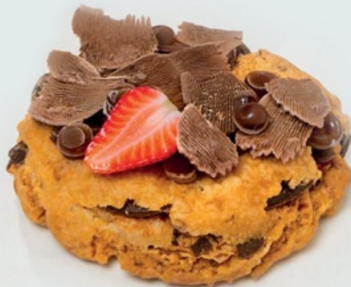
GALLETAS QUE ANTOJAN