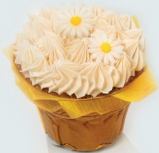
MUFFIN QUE SORPRENDEN

SORPRENDAMOS CON CREATIVIDAD, SABOR Y DULZURA.